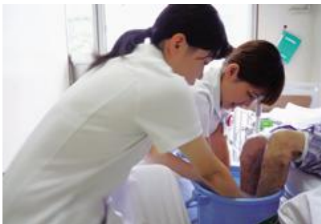
看護師と一緒に患者さんに足浴介助

アンケート結果から進路を選ぶにあたり、今回の体験が「とても参考になった」（100%）、と良い結果でした。来年度も今年の実験をもとに更に良い体験ができるよう企画・運営していきたいと考えています。関係者の皆様ご協力ありがとうございました。