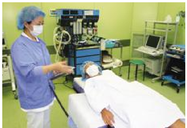
手術台に乗ってみる