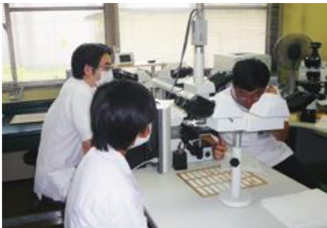
顕微鏡をのぞきながら病理医長より標本の説明を受ける（左手前）

3日間の期待と緊張の長いようでも短い期間の体験ではありましたが、病院を去る日には、少し大人になったような自信と希望のオーラが体中から発散していました。10年先には、当院で立派な医療人として勤務し活躍している彼女が見られることと期待します。