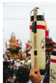
長張り提灯で山車の動きを指示する

山車の造り・飾りは北関東一を誇っていて、勇壮・荘厳で威勢のあるこの祭りに、皆さん、是非参加してみませんか。次回開催は平成24年の真夏です。