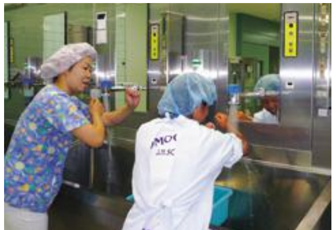
手術前の手洗いを体験する（右）