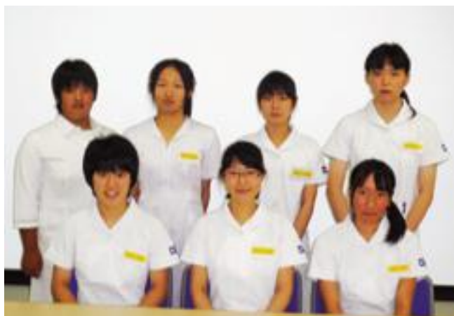
ふれあい看護体験集合写真