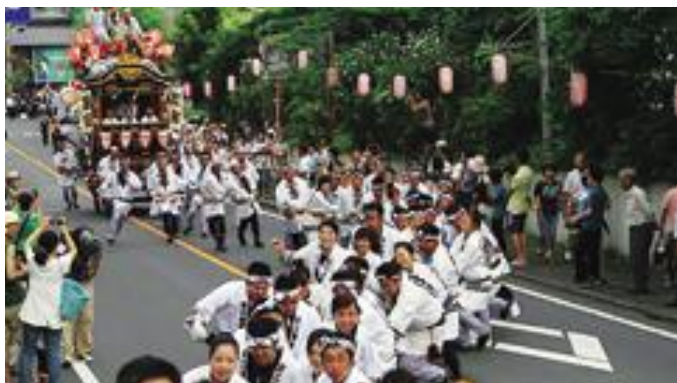
暴れ山車が八幡宮への急坂を蛇行して登る